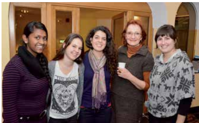
Im Kanton Luzern lebt eine neue Generation von Secondos und Secondas: Menschen, die alle Facetten ihrer Identität offen leben und ausdrücken