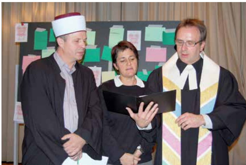
Christlich-muslimisches Gebet in Reiden