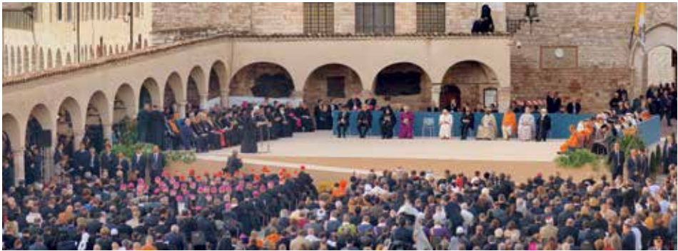
Würdenträger aus verschiedenen Religionen beten in Assisi für Frieden und gegenseitigen Respekt