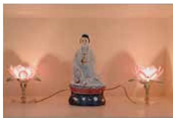
Im Andachtsraum des Paraplegikerzentrums Nottwil haben verschiedenste Religionsgemeinschaften eine Gebetsnische gestaltet