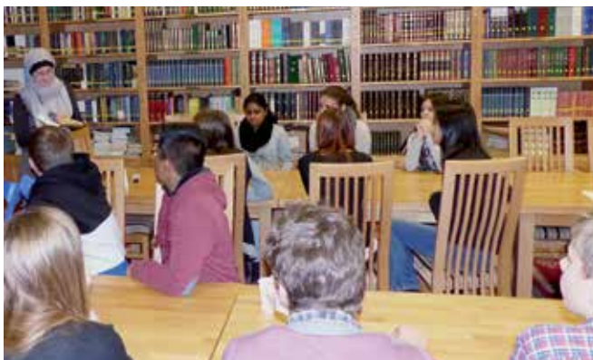
In der bosnischen Moschee in Emmenbrücke lernen Schulkinder aus verschiedenen Kulturen den islamischen Glauben kennen