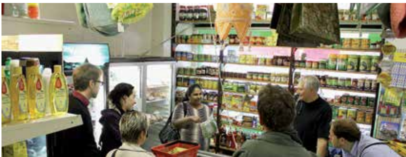
Einkaufen in der Luzerner Baselstrasse ermöglicht Begegnung mit anderen (Ess-)Kulturen