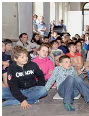
«Unter einem Dach»: Kinder hören Geschichten aus den Weltreligionen ...

Kontakt: Katholisches Pfarramt Römerswil, Tel. 041 910 13 51