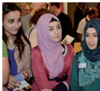
... muslimisch-jüdisches Gespräch ...