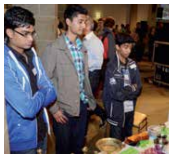
... und tamilische Jugendliche erklären ihren Glauben