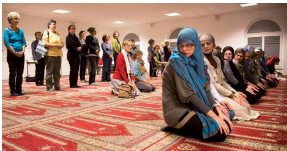
An christlich-muslimischen Gesprächen teilen Frauen miteinander ihren Glauben und begegnen einander offen und respektvoll