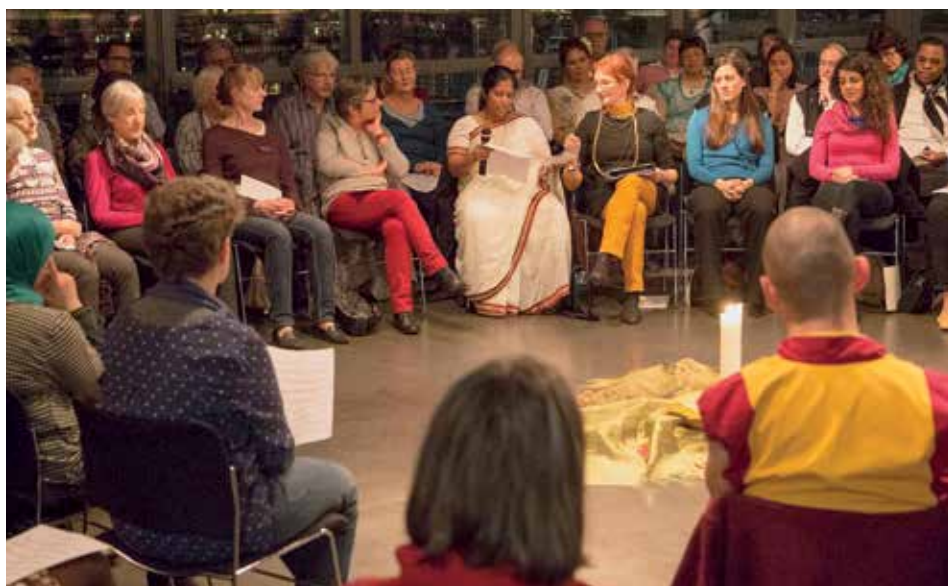
Interreligiöses Friedensgebet im KKL Luzern: Die gemeinsame Vorbereitung ist genauso wichtig wie die Feier selbst

Kontakt: www.kathluzern.ch/migration-und-integration