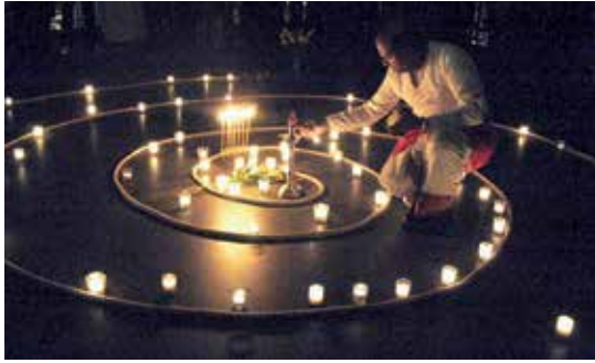
Licht wird als Symbol in vielen Religionen verwendet; das kommt auch an der Luzerner Friedensfeier zum Ausdruck