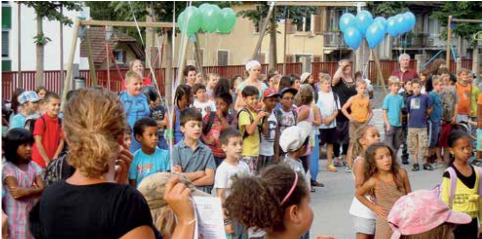
Kulturelle Vielfalt, hier im St. Karli-Schulhaus, Luzern, bedeutet auch religiöse Vielfalt