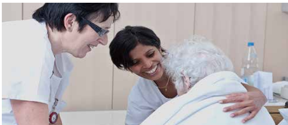
Im Gesundheitswesen stammen Pflegende und Betreute aus verschiedenen Kulturen; interreligiöser Dialog ist hier angesichts existenzieller Fragen besonders wichtig