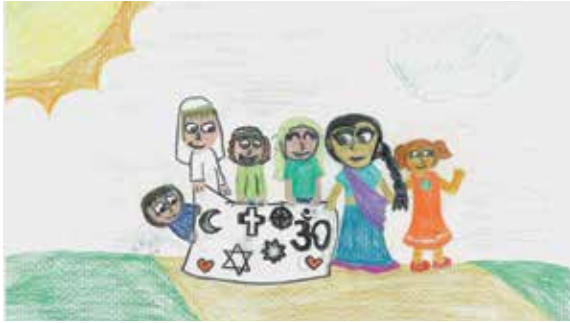
Religiöse Vielfalt aus der Sicht von Kindern einer Horwer Schulklasse