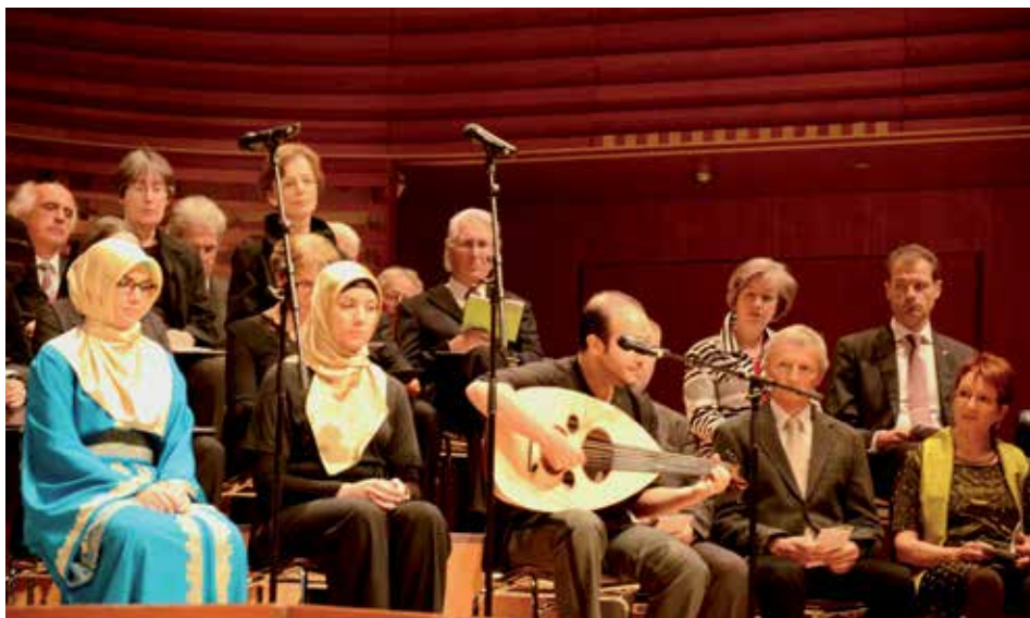
Musik als verbindendes Element an der Bettagsfeier im KKL