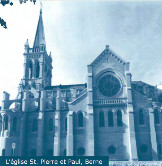
L'église St. Pierre et Paul, Berne